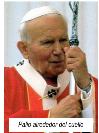
Palio alrededor del cuello

Los Palios los preparan las Oblatas de San Francisco de Roma, y la lana que se usa se toma de corderitos bendecidos en la Iglesia de Santa Inés en la fiesta patronal. Una vez confeccionados, los Palios son bendecidos por el Papa en la fiesta de San Pedro y San Pablo, y se guardan en un cofre en la Basílica de San Pedro, hasta ser entregados a los Arzobispos del mundo.