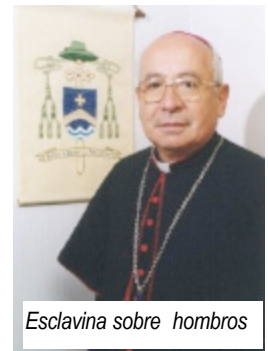
Esclavina sobre hombros

Los rectores de basílicas pueden llevarla de color negro con botones rojos, también otros prelados pueden usarla como signo de su autoridad en la comunidad.